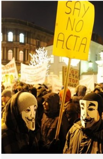
Οι Πολωνοί διαδηλωτές αντιδρούν στην ACTA καθώς θεωρούν ότι θα περιορίσει στοιχειώδη κοινωνικά και ψηφιακά δικαιώματα, μεταξύ των οποίων η ελευθερία στην έκφραση και στο απόρρητο των επικοινωνιών