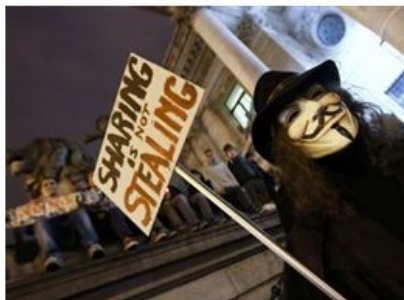
Δράση ανέλαβαν οι χακτιβιστές Anonymous κατά της υπογραφής της συνθήκης ACTA, με χτυπήματα σε επιλεγμένους στόχους και μηνύματα-βίντεο πίσω από την ιστορική μάσκα του Guy Fawkes.